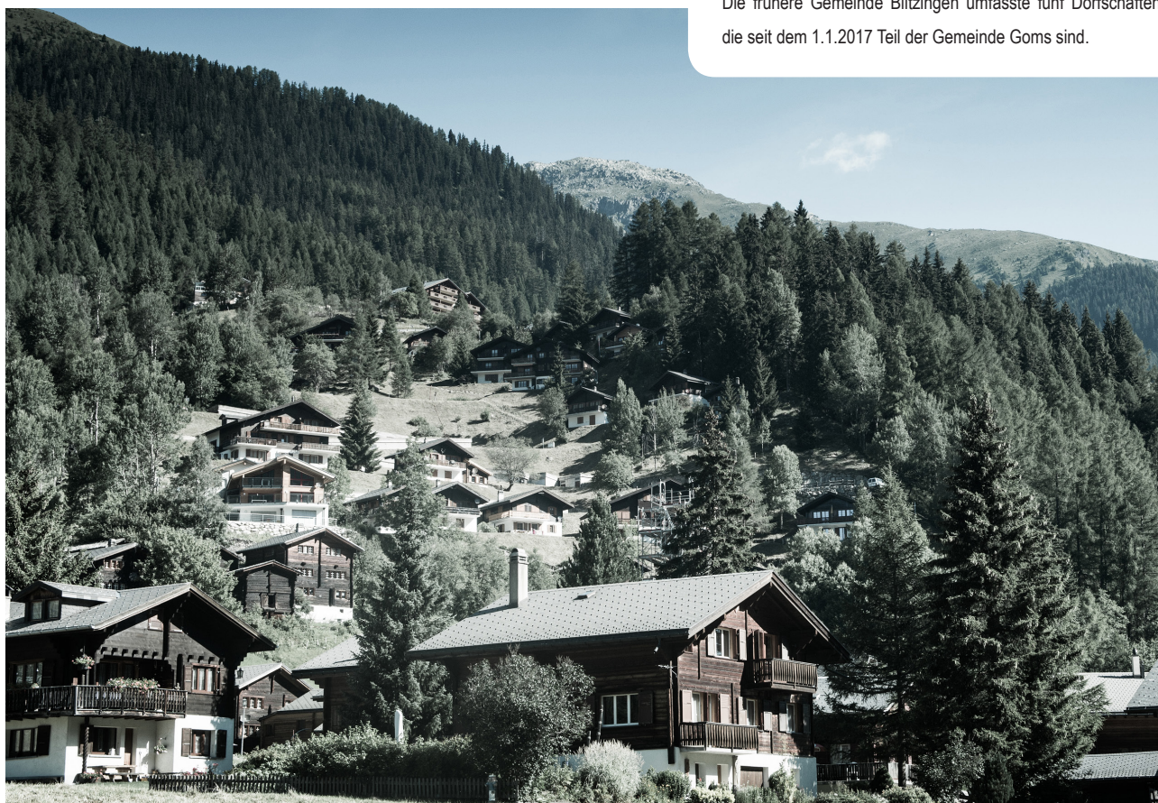
Die frühere Gemeinde Blitzingen umfasste fünf Dorfschaften, die seit dem 1.1.2017 Teil der Gemeinde Goms sind.

Ein Fusionsprozess ist enorm zeitintensiv. Es gibt unzählige Themenfelder, die abgehandelt werden müssen. Auch wenn der Sinn einer Fusion unbestritten scheint, führen einzelne Entscheidungen zu emotionalen Diskussionen. Das Prozessbüro hat uns als Leitungsgremium bei solchen Diskussionen an das übergeordnete Ziel und die sachlich erarbeiteten Grundlagen erinnert. Die klare Rollen- und Aufgabenteilung ermöglichte uns ein gezieltes Vorgehen und eine effiziente Entscheidungsfindung.