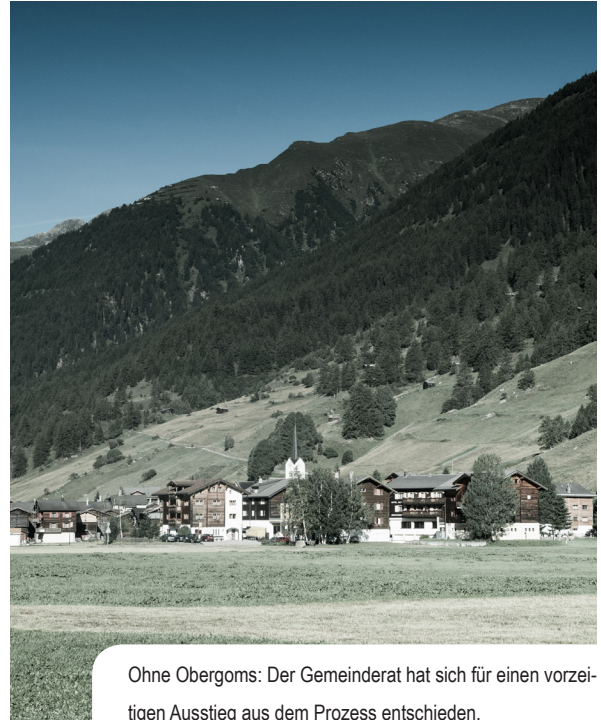
Ohne Obergoms: Der Gemeinderat hat sich für einen vorzeitigen Ausstieg aus dem Prozess entschieden.

Die Gemeinde Obergoms ist erst 2009 durch die Fusion von Obergesteln, Oberwald und Ulrichen entstanden. Trotz dieser jungen Vergangenheit hat sich unser Gemeinderat nach der Vorabklärung dafür entschieden, in den Fusionsprozess einzusteigen. Im Verlauf der Analyse haben sich die Perspektiven jedoch gegen unsere Vorstellungen entwickelt. Deshalb haben wir uns in der Vernehmlassung zum Fusionsbericht für den Ausstieg aus dem Prozess entschieden. Meines Erachtens ein legitimer, wenn auch unbeliebter Entscheid.