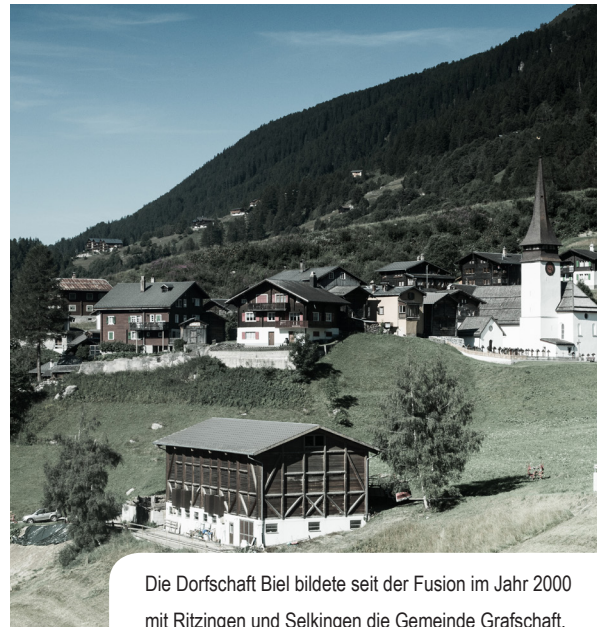
Die Dorfschaft Biel bildete seit der Fusion im Jahr 2000 mit Ritzingen und Selkingen die Gemeinde Grafschaft.

Neben einer klaren Aufbau- und Ablauforganisation im Prozess ist für eine erfolgreiche politische Arbeit transparente Kommunikation entscheidend. Ein Kommunikationsplan kann einen wichtigen Orientierungsrahmen bieten, braucht aber in der Umsetzung viel Flexibilität für prozessorientierte Anpassungen. Im Grundsatz empfiehlt sich eine aktive Kommunikation gegen innen und aussen: