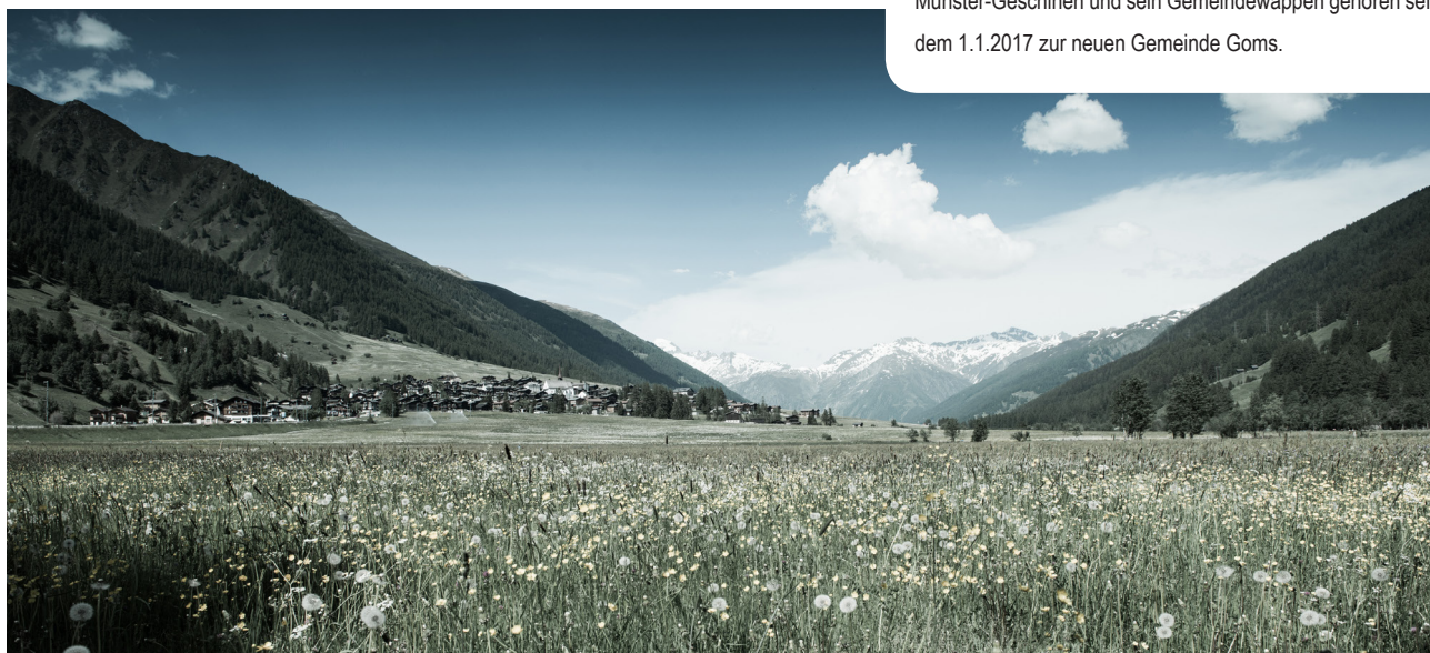
Münster-Geschinen und sein Gemeindewappen gehören seit dem 1.1.2017 zur neuen Gemeinde Goms.

Entscheiden sich mehrere Gemeinden dazu, einen Fusionsprozess anzugehen, sind in einem ersten Schritt die Aufgaben und Rollenteilungen festzulegen. In einem zweiten Schritt ist der Fusionsablauf zu definieren (vgl. u.a. Amt für Gemeinden und Raumordnung, Kanton Bern 2005; Fetz & Bühler 2005; Käppeli, Willimann & Bürkler 2009; Amt für Gemeinden, Kanton Luzern 2010). Ausführungen dazu folgen in den nächsten Kapiteln.