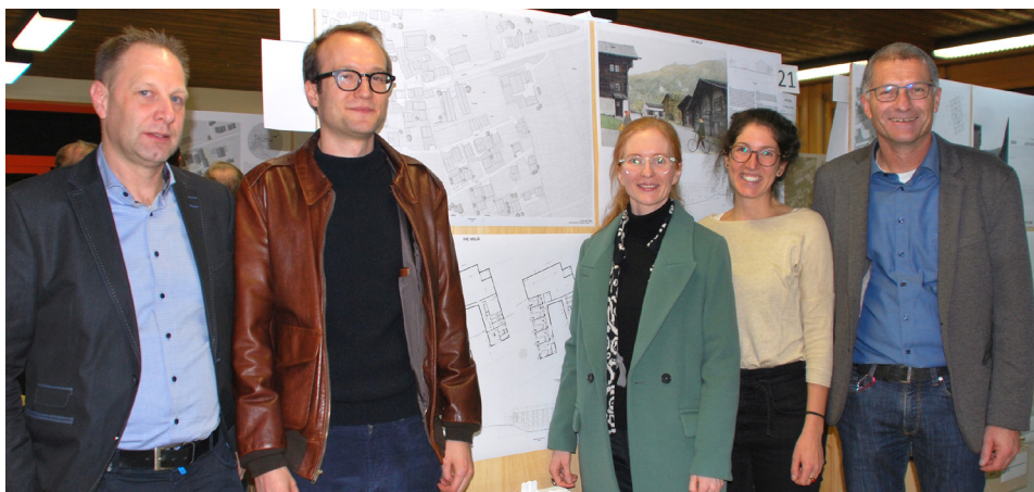
Vernissage zum Architekturwettbewerb für das neue Gesundheitszentrum Ober/Goms im Dezember 2019, mit dem Siegerprojekt „Ine Mejjä“

Mit dem Bau eines neuen Gesundheitszentrums folgen die Gemeinden Obergoms und Goms dem Trend hin zu regionalen und interdisziplinären Versorgungsnetzwerken. Das Zentrum wird neben einer hausärztlichen Gemeinschaftspraxis weitere Dienstleistungsbetriebe aus den Bereichen Gesundheit, Pflege und Betreuung beherbergen sowie barrierefreien Wohnraum integrieren. Die RWO AG wurde mit der Projektleitung beauftragt. Im vergangenen Jahr wurde der Architekturwettbewerb durchgeführt, aus dem das Projekt «Ine Mejjä» der Zenklusen Pfeiffer Architekten AG als Sieger hervorging. Der Baubeginn ist für 2021 vorgesehen. 2023 soll das neue Gesundheitszentrum Ober/Goms in Betrieb gehen.