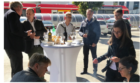
Ein Meilenstein in der Bahnhofplanung: Kick-off mit dem Generalplaner IG Brig+ im Oktober 2019.

Der Bahnhof Brig/Naters soll sich in den nächsten Jahren zu einer gut organisierten Umsteigeplattform weiterentwickeln und dabei zahlreichen Ansprüchen an Sicherheit, Funktionalität und Ästhetik gerecht werden. Nach verschiedenen Planungsschritten mit Testplanung (2012), Rahmenplan (2013), Architekturwettbewerb (2015) und Vorprojekt (2017) hat die Steuerungsgruppe 2019 einen Generalplaner bestimmt: Die Ingenieurgemeinschaft (IG) Brig+ hat sich das Mandat für dieses aussergewöhnliche Bauvorhaben mit seinen 18 Teilprojekten gesichert. Parallel zur Vergabe des Generalplanmandats haben sich die Stadtgemeinde Brig-Glis, die MG Infrastruktur AG, der Kanton Wallis, die SBB Immobilien und BLS Immobilien AG mittels Bauherrenvereinbarung zur Bauherrengemeinschaft zusammengeschlossen. Mitte 2023 soll mit den Bauarbeiten begonnen werden.