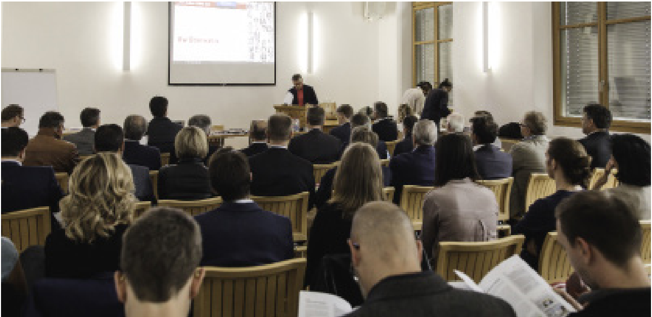
Generalversammlung 2019 in Brig-Glis.