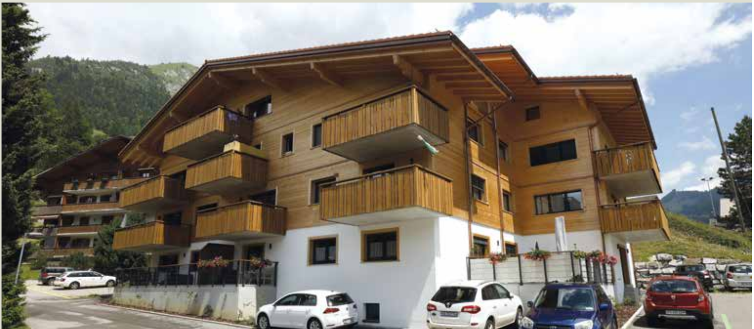
Das Projekt stand mehrfach auf der Kippe – doch am Ende wurde das Engagement belohnt.