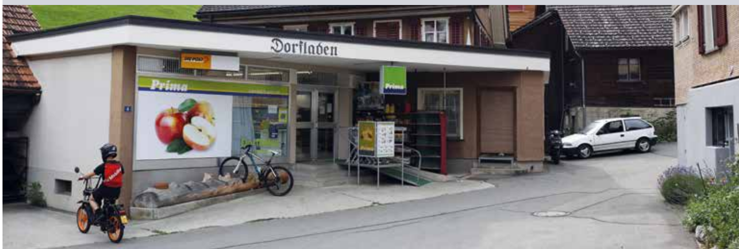
Über dem Dorfladen sind Mietwohnungen entstanden.

Am Anfang stand die Erhaltung des Dorfladens. In kleinen Schritten schaffte es die finanzschwache Gemeinde in den Urner Bergen danach, für Junge attraktiver zu werden. Der Bau von Alterswohnungen wäre der nächste – grosse – Schritt.