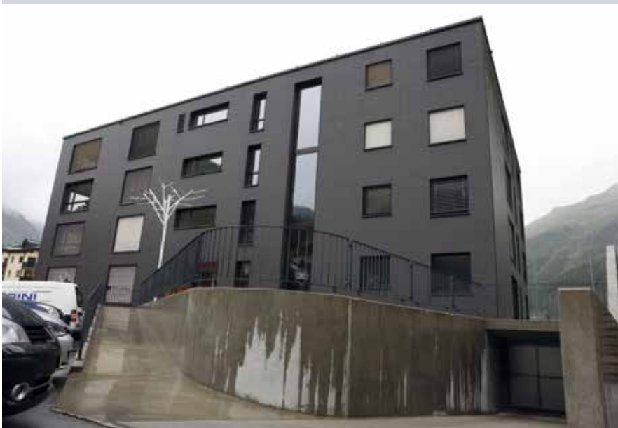
27 Wohnungen für junge Einheimische.

Das Lehrlingsheim reichte nirgends hin – und nach der Lehre mussten die Berufsleute anderswo ihr Glück suchen, da es für sie in Samedan keine erschwingliche Wohnung gab. Dank der Genossenschaft «wohnen bis 25» können sie bleiben, bis sie beruflich Fuss gefasst haben.