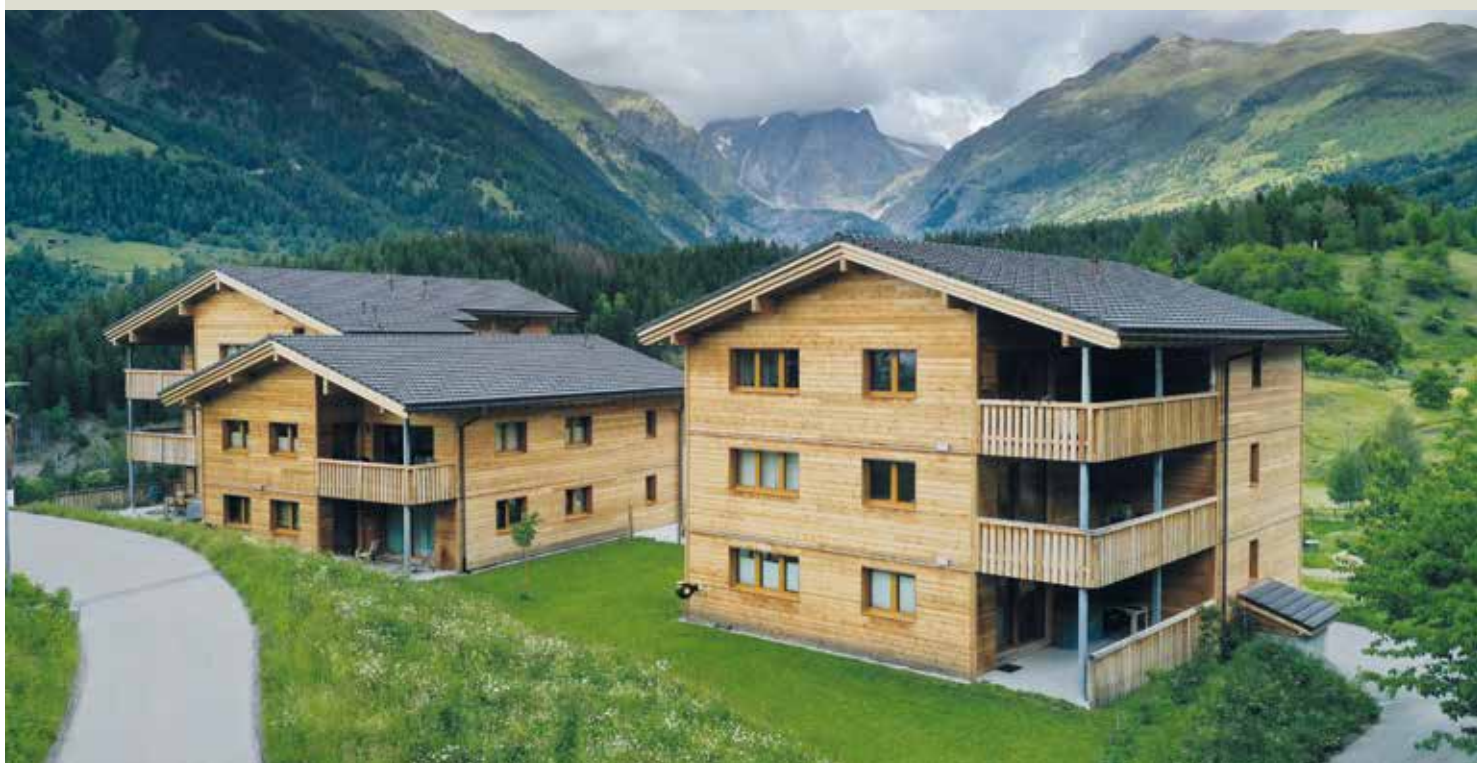
Die neuen Gebäude oberhalb des historischen Dorfkerns sind voll vermietet.

Die Gemeinde gründete eine Genossenschaft, die attraktive und bezahlbare Mietwohnungen für junge Einheimische baute. Das Projekt wäre beinahe an der mangelnden Unterstützung von Banken und Pensionskassen gescheitert.