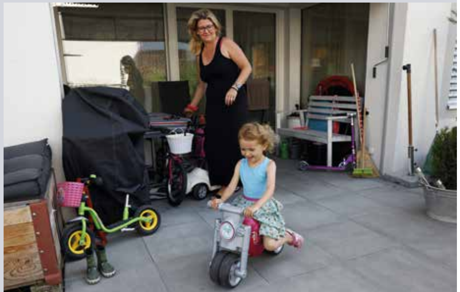
Im Erdgeschoss können Familien die Terrasse nutzen.