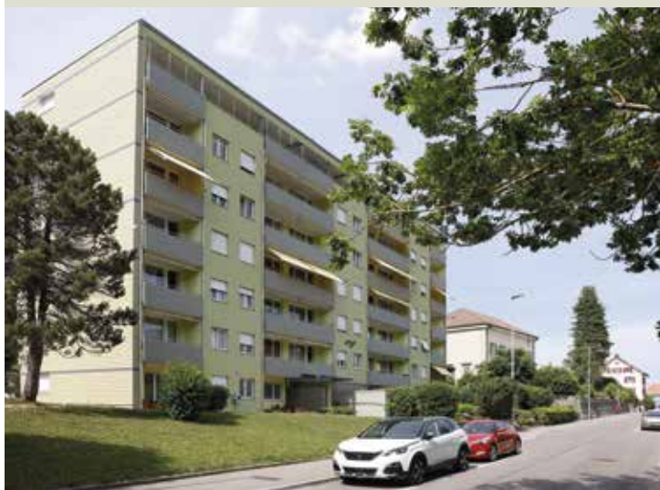
Die Sanierung erfolgte über Jahre in zwei Etappen.

Die Renovation des Gebäudes für Ältere und Behinderte war ein Kraftakt. Das Resultat freut die Stiftung ebenso wie die Gemeinde, die neues Land für ein neues Projekt im Baurecht zur Verfügung stellen will.