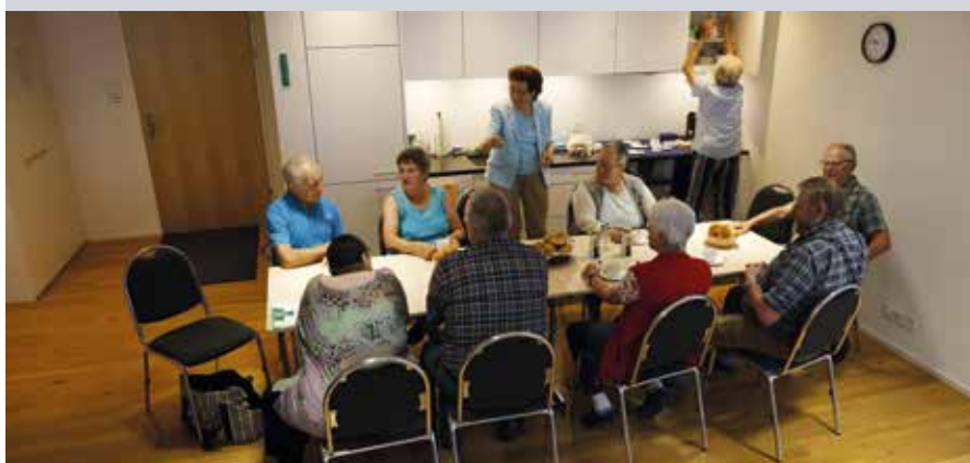
Im Gemeinschaftsraum trifft man sich zu Kaffee und Gipfeli.

Um der Abwanderung Einhalt zu gebieten, gründete die Gemeinde eine Stiftung, die ein Haus für ältere Menschen baute. Diese können jetzt zentral wohnen und machen Wohnraum frei für Familien.