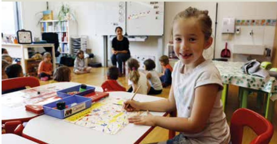
Unten im Haus werden Kinder unterrichtet...

Eine baufällige Schule, zu wenige Wohnungen für ältere Menschen und junge Paare, sinkende Einwohnerzahlen: Die Walliser Berggemeinde Saint-Martin hatte mehr als nur ein Problem. Mit dem Bau eines Mehrgenerationenhauses hat sie viele gelöst.