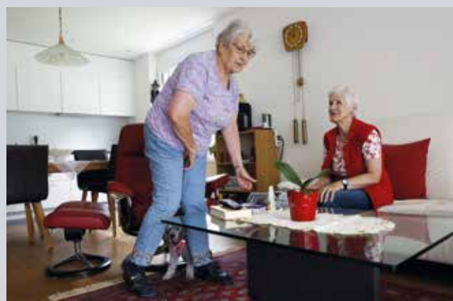
Die Bewohnerinnen besuchen sich gegenseitig.

Die Jungen möchten eigentlich im Dorf bleiben. Doch Bauland ist zu teuer, um sich ein Haus bauen zu können – also gehen sie: Dieses Problem kennen viele Berggemeinden. Wolfenschiessen hielt schon früh dagegen. 1990 gründete die Nidwaldner Gemeinde die Stiftung «Wohnen und Arbeiten in Wolfenschiessen». Ihr Zweck: preisgünstigen Wohn- und Gewerberaum bereitzustellen.