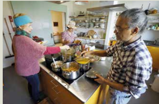
... was in der Gemeinschaftsküche zubereitet wurde.

Lange stand das über 100jährige Jugendstilhotel «Belmont» an schönster Lage ob Wilderswil leer, der Abbruch war schon beschlossene Sache. Bis 2013 zwei pensionierte Frauen aus dem Unterland kamen, um hier ihre Vorstellung einer neuen Wohnform zu realisieren: gemeinschaftlich zu ortsüblichen Preisen wohnen und dabei auf die Umwelt Rücksicht nehmen.