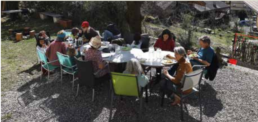
Auf der Terrasse ob Wilderswil wird gegessen...

Singles und Paare jeden Alters sind in ein ehemaliges Jugendstilhotel eingezogen, um gemeinschaftlich zu wohnen. Die Gemeinde legte dem Amtsschimmel Zügel an – und wurde mit der Rückkehr Weggezogener belohnt.