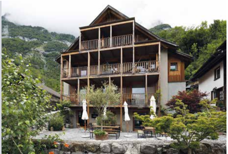
Die ehemalige Bauruine bietet Raum für Wohnen und Gewerbe.