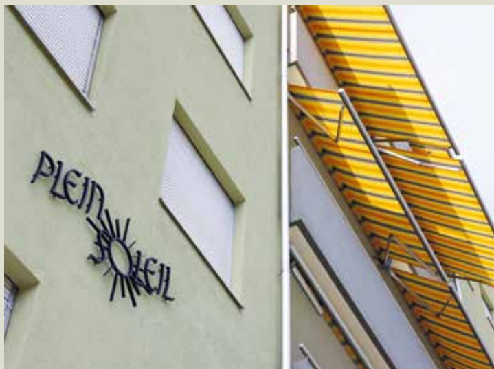
Das Gebäude erstrahlt in neuem Glanz.