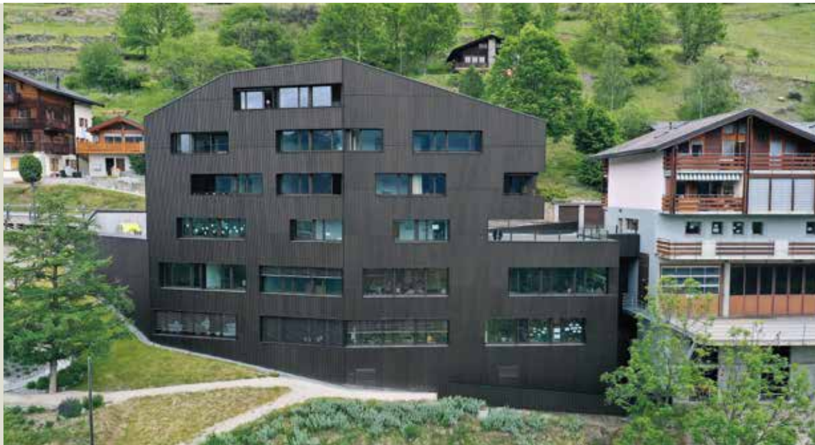
Seit Saint-Martin ein Mehrgenerationenhaus hat, steigt die Einwohnerzahl.