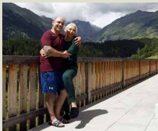
Die grosse Terrasse bietet zusätzlichen Raum.

Bewährt habe sich das Genossenschaftsmodell: Dank ihm sind die Wohnungen der Spekulation entzogen.