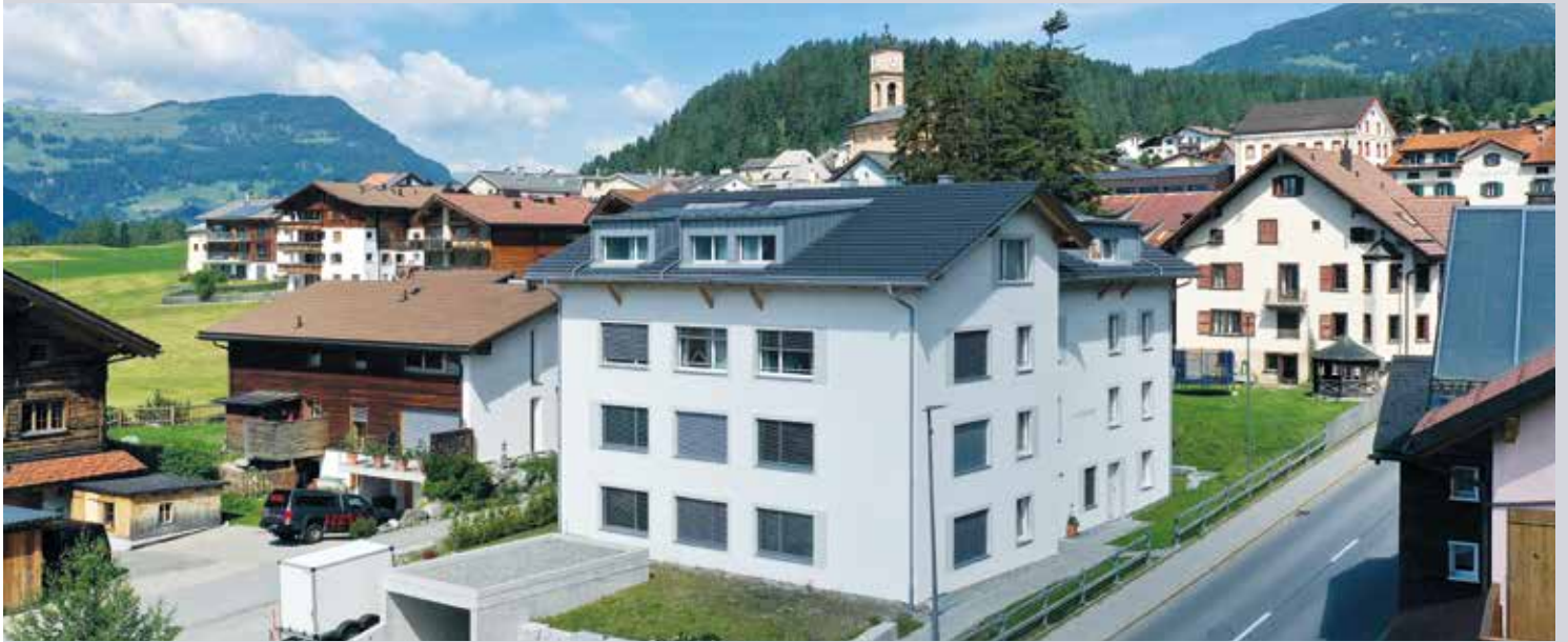
Der Neubau im Zentrum von Lantsch/Lenz fügt sich gut ins Ortsbild ein.

In unmittelbarer Nähe zur Lenzerheide ist bezahlbarer Wohnraum rar. Die Gemeinde griff zur Selbsthilfe und gab Land im Baurecht an eine Genossenschaft ab. Den ersten 8 Wohnungen sollen 20 weitere folgen.